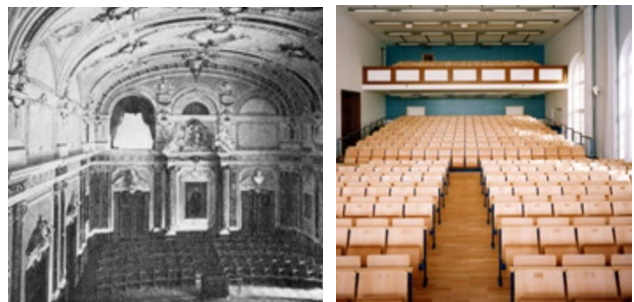
Audimax der Neuen Universität am Sanderring früher und heute

Das Gebäude zählt bis heute zu den schönsten Bauten der Stadt, trotz der Bombardierung Würzburgs am 16. März 1945. Die wohl größte Baumaßnahme nach dem Wiederaufbau war die Ergänzung der Neuen Universität vor 50 Jahren durch einen vierten Flügel und den vielseitig nutzbaren, prächtigen Lichthof, wo auch die Ausstellung des Universitätsarchivs „125 Jahre Neue Uni“ noch bis 28.02.2022 zu sehen ist. Der Eintritt ist frei. Mehr Infos finden Sie im Bericht des EinBLICKs.