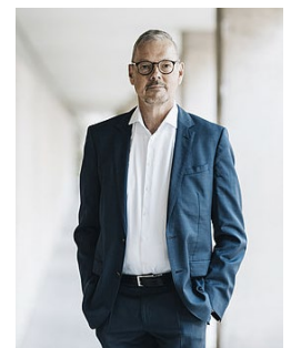
Prof. Dr. Peter Bofinger

Professor Dr. Peter Bofinger fordert von den Verantwortlichen in einem Gastkommentar im Handelsblatt weniger Spekulationen über Szenarien bezüglich der Renten in ferner Zukunft und schlägt vor, lieber Reformen anzugehen, die man heute beschließen kann. Es sei nicht hilfreich, schon heute die Öffentlichkeit mit langfristigen Projektionen zu verunsichern und damit Empörung zu provozieren. Prof. Bofinger schlägt vielmehr die Einbeziehung der Selbstständigen in die Gesetzliche Rentenversicherung vor, da Berechnungen zeigen, dass damit eine deutliche Entlastung geschaffen werden kann. Er schreibt: „Der Effekt resultiert aus der Logik des Umlagesystems. Wenn junge Selbstständige in die Rentenkasse einzahlen, erhalten sie die Rente erst Jahrzehnte später. Wenn es so weit ist, wird ihre Rente von neuen jungen Selbstständigen gezahlt. Entlastend käme hinzu, dass es weniger Selbstständige ohne Altersversorgung geben würde, für die der Staat die Grundsicherung im Alter zahlen muss.“